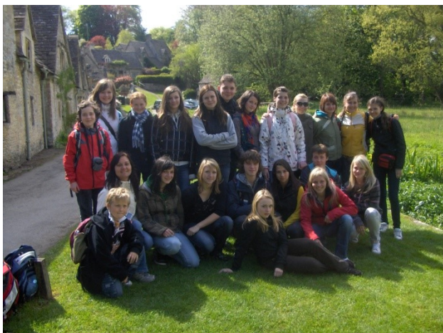
Studijní pobyt v Anglii