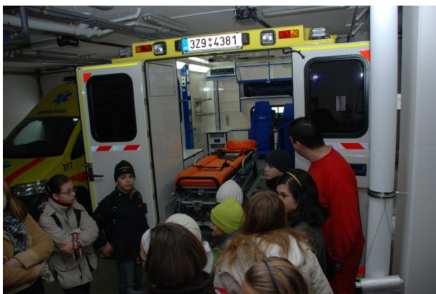
Projektový den – záchraná stanice