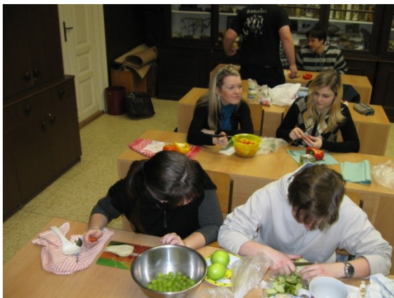
Praktická výuka v biologii – zdravá výživa