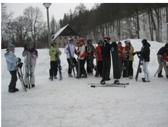
Lyžařský kurz sekund