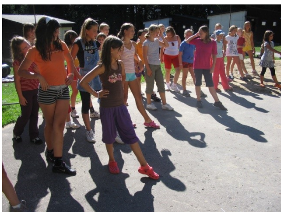
Adaptační kurz prim