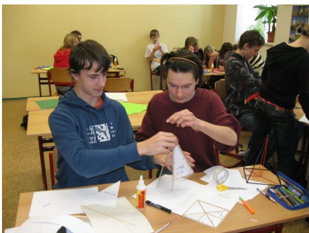
Praktická výuka v matematice – tvorba tělesa