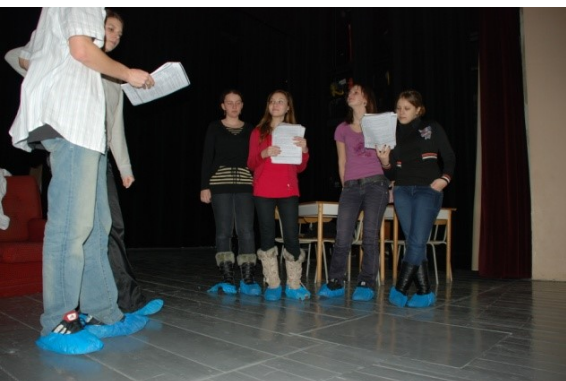
Práce dramatického souboru