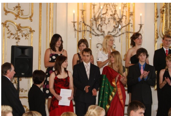
Maturanti ve Sněmovním sále