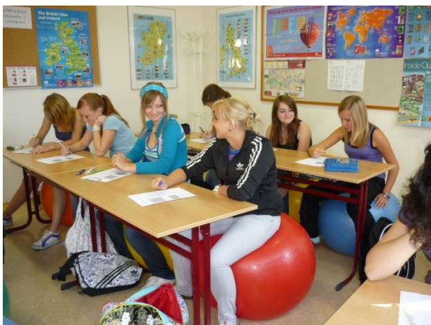
Výuka v jazykové učebně