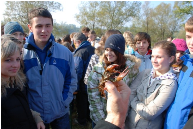
Vypouštění raků na Bagráku v rámci EVVO