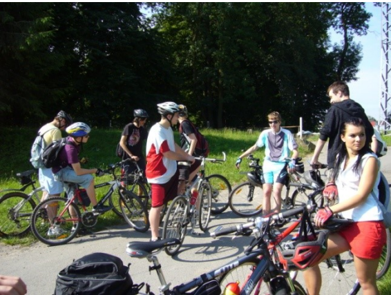
Sportovní den školy