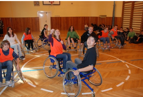
Paralympijský školní den