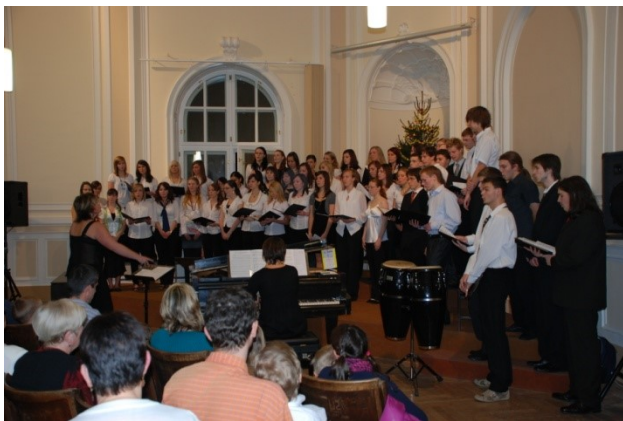
Vánoční koncert pěveckého sboru