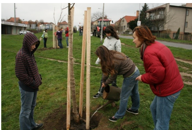
Projekt třídy – výsadba stromů