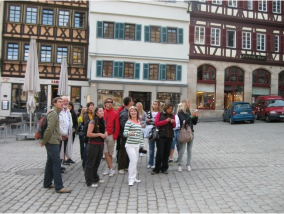
Družební setkání v Bad Urach